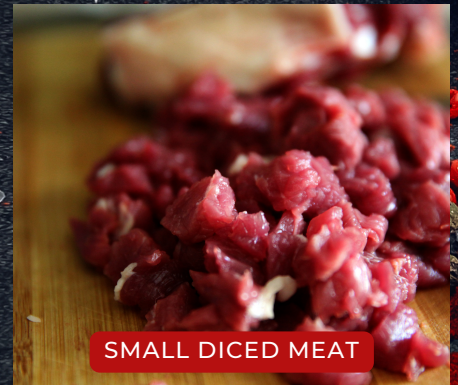
SMALL DICED MEAT

Бүх төрлийн хоолны махыг захиалгын дагуу хэрчиж бэлдэж өгнө. Үүнд гуляш, нарийн мах, цуйван, будаатай хуурга болон бууз хуушуурны махыг гараар татсан мэт шоо дөрвөлжин хэрчин өгнө.