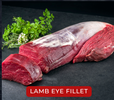
LAMB EYE FILLET

Ангилж бэлтгэсэн хонины хавирга. Ресторан, зоогийн газрууд шууд шарж амталхад бэлэн ангилсан мах.