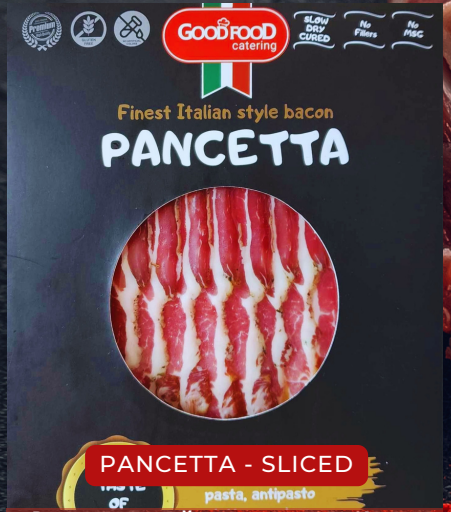
PANCETTA - SLICED

Bratwurst зайдас нь нитрит ордоггүй тул өнгө нь цайвар байдаг бөгөөд ямар нэг мах орлуулагчгүй 100% үхэр, гахайн махаар хийж Герман амт жороор нь амталж хийдэг тул хэрэглэгчиддээ маань хамгийн эрүүл зайдас гэж үнлэгддэг. Амралтын газар, зочид буудал, зоогийн газрууд манай зайдсыг ашиглан төрөл бүрийн чанартай өглөөний цай бэлдэх мөн ил гал дээр шарж улам амт оруулж, чанартай амттай бүтээгдэхүүн үйлчлүүлэгчиддээ санал болгох боломжтой.